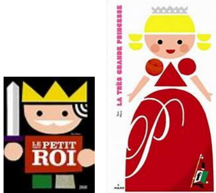
Albums découverts et beaucoup appréciés lors de cette période.