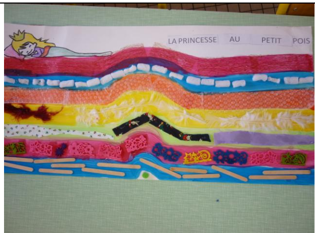
La princesse sur son lit aux nombreux matelas tracés et décorés par les enfants. Le petit pois est tout en dessous. Va-t-elle le sentir ? Est-elle une véritable princesse ?