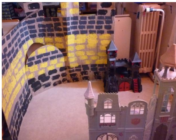
Jeux libres et création du château