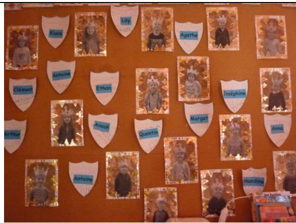
Nos portraits sur papier vieilli au brou de noix. Boucliers décorés de créneaux et prénoms en écriture scripte.