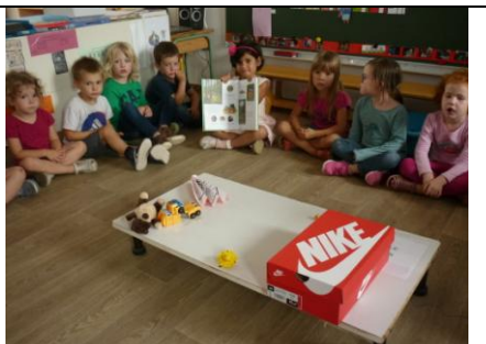
Table d'exposition : nos présentations individuelles.