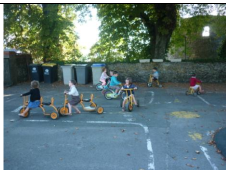
Sortons les vélos et apprenons à les utiliser.