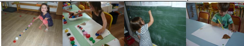
Alignements et horizontalité : prémices aux gestes de l'écriture.