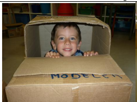
Ateliers Cartons : Apprendre à jouer ensemble, prêter, se parler, s'organiser, accéder aux jeux symboliques.... : chaque mardi matin.