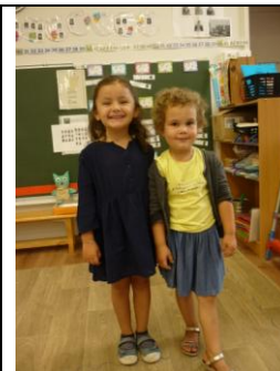
Mesurons notre taille grâce à la toise. Nous allons grandir cette année encore !