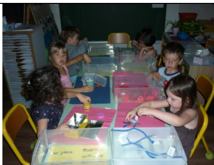
Ateliers d'inspiration Montessori et apprentissages différenciés.