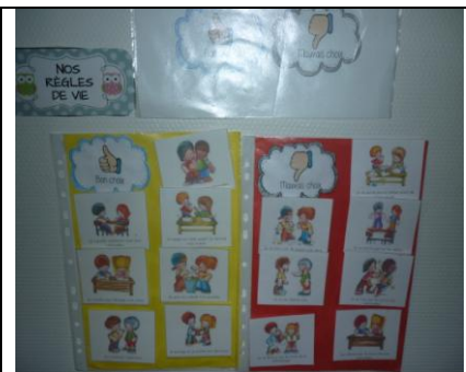
Mise en place des règles de la classe : bons et mauvais choix, mettons nous d'accord !