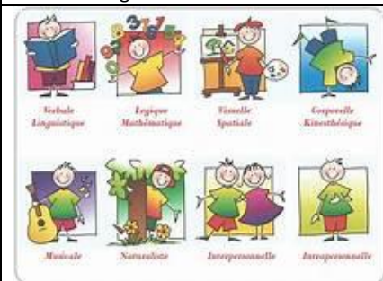
Les intelligences multiples : A la recherche de nos intelligences principales. Chacun à sa façon d'accéder aux apprentissages, trouvons laquelle par l'intermédiaire d'activités au choix.