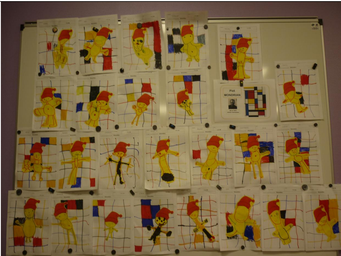
Bonhomme du mois de décembre à la manière de Piet Mondrian.

Semaine 4 : Noël approche... nous nous y préparons.