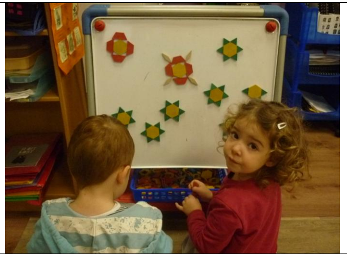
Mandala de Noël collectif. Bravo les artistes !!