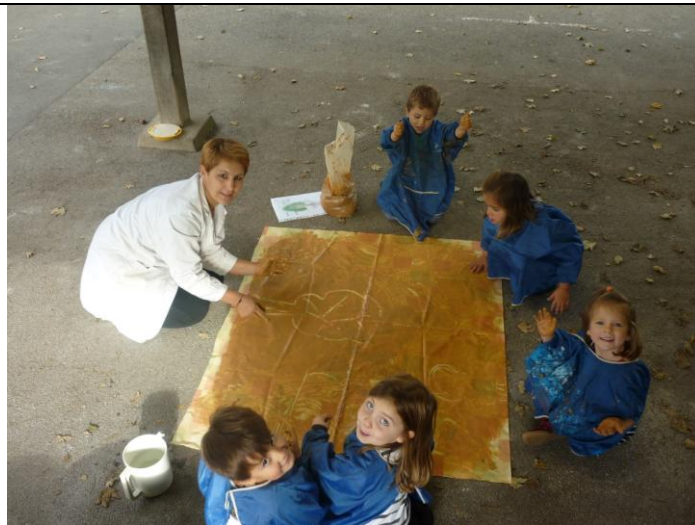
Dessin d'arbres à plat en réinvestissant le vocabulaire appris ces derniers jours.

Ces derniers jours, nous avons beaucoup manipulé la terre glaise, suite à la lecture de « flaque de bouillasse ».